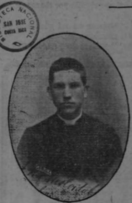
PERO. DON JORGE VOLIO

Mañana a las 8 a. m., en la iglesia parroquial de Heredia dará su misa de gracia, — acto solemne que sigue a la rehabilitación — el ilustrado Presbítero doctor Jorge Volio, a quien le ha tocado recibir un aura espiritual de S. S. Pio X.